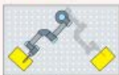
2 radna stanica