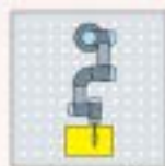
1 radna stanica