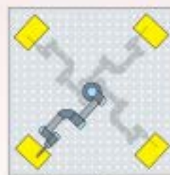
4 radna stanica

Kompletna robotska stanica za zavarivanje bazirana na kolaboracionom robotu - COBOT UR 10 i LORCH SPEED visokoproduktivnoj tehnologiji zavarivanja (Full process) je idealna kombinacija opreme prilagodjene brzim